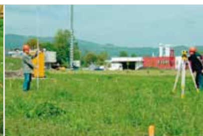
Nivellements de surface

La Série Leica Jogger est le partenaire idéal pour tout vos travaux de nivellement.