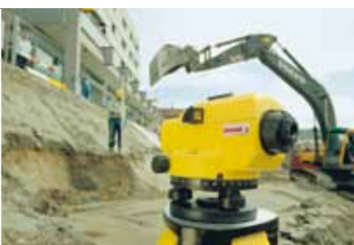
Mesures de profils