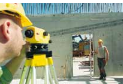
Bâtiment Travaux Publics

Niveaux automatiques – utilisables à tout moment!