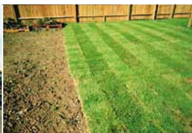
Réalisation d'un jardin